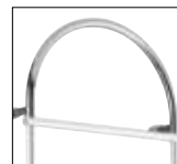
Optionals pag. 170

ACCESSORI DISPONIBILI A RICHIESTA OPTIONALS AVAILABLE ON REQUEST ДОПОЛНИТЕЛЬНЫЕ ОПЦИИ