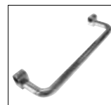
Optionals pag. 174