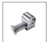
Optionals pag. 173