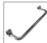
Optionals pag. 174

ACCESSORI DISPONIBILI A RICHIESTA OPTIONALS AVAILABLE ON REQUEST ДОПОЛНИТЕЛЬНЫЕ ОПЦИИ